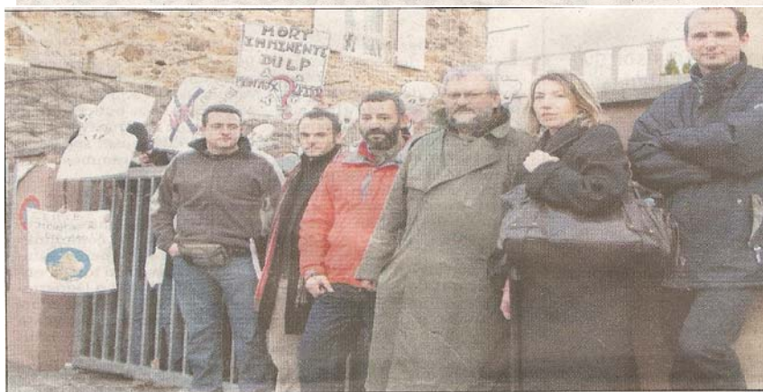
Pour s'opposer à la fermeture de la section BEP bio-service et à la généralisation du bac pro en 3 ans, les professeurs du lycée professionnel Montgolfier ont mené hier une opération "lycée gelé".