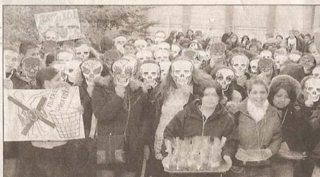
La journée lycée mort a été l'occasion de montrer son mécontentement de manière singulière.

Les mécontents dénoncent encore la manœuvre de Bercy et de l'Union des industries et des métiers de la métallurgie pour réduire le temps de formation afin de faire des économies et tuer les petits lycées, pour laisser la culture générale à l'Education nationale et réserver les compétences professionnelles aux entrepreneurs, pour délivrer un certificat de compétence et fabriquer un seul produit alors qu'un diplôme donne